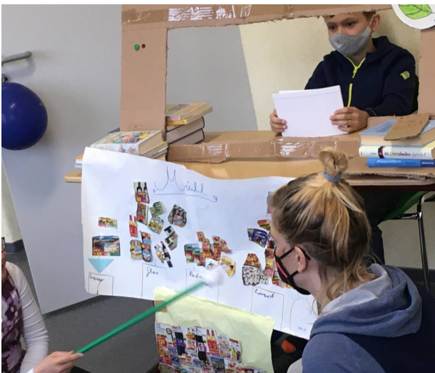
Wandzeitung: Mülltrennung (oben) Modell: Magnetisches Auto (unten)