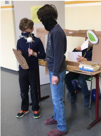
Theater: Markerman rettet die Welt