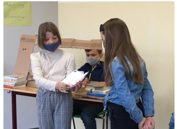
Comic: Waldbrände (oben) Modell: ein Hoverboard (unten)