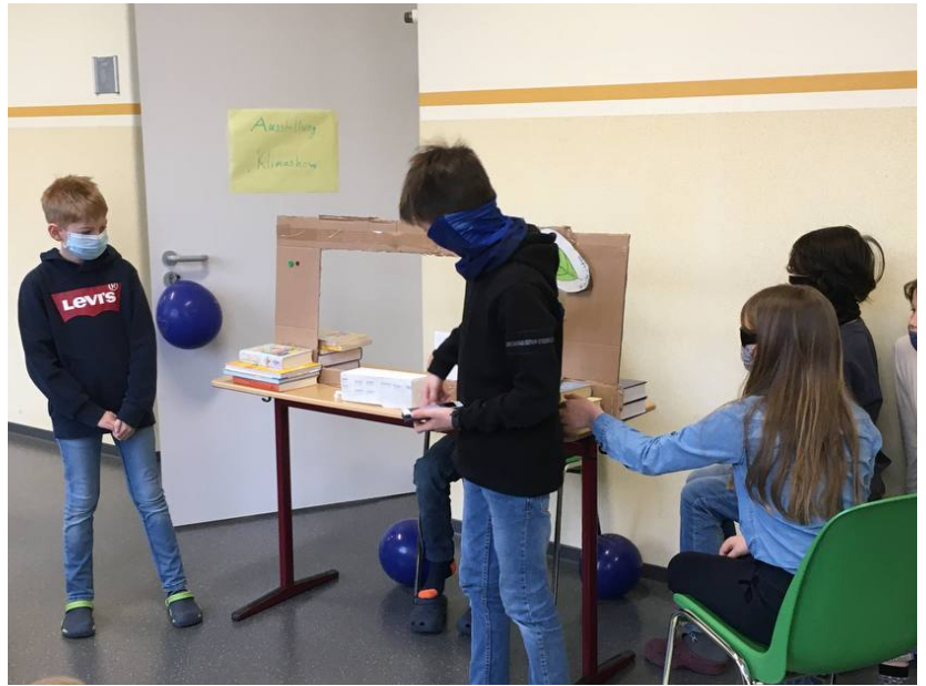
Wie funktioniert eine Papierfabrik?